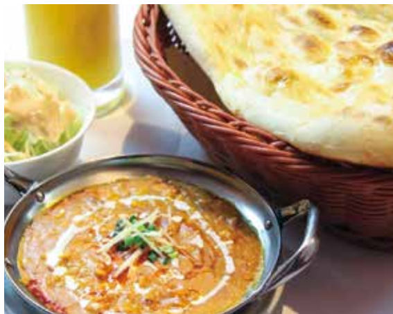
サービスランチ700円(900円~ナン・ライスおかわりOKのお得なセットもあります)

本格インドカレー店として人気を誇る同店。みのり台店・松戸東口店・流山平和台店・北柏店・本店の南増尾店と5店舗運営されています。お子様からお年寄りまで幅広い方たちに親しまれ、この店の味を求めて何度も訪れるお客様も多い同店。気さくで楽しいシェフ達が、本場の味を提供してくれまます。味の決めとなるベースはたまねぎをじっくり炒め、そこに23種類のスパイスを加えて2日間かけて作ったもので、味にコクと深みを生みだします。また、カレーは注文を受けてから調理するので、できたてを最高の味で食べられます。タアバンのカレーはサラサラ系のカレーではなく、とろみのあるカレー。このカレーとナンの相性は抜群です!記者の私にはたまにはライスで食べよう