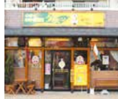
みのり台店 TAIRAYA斜め向い