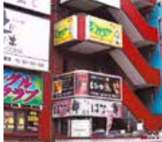
松戸店 東口出てすぐ茶色いビル