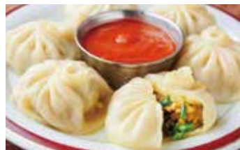
おすすめサイドメニュー ネパールの蒸し餃子モモ500円