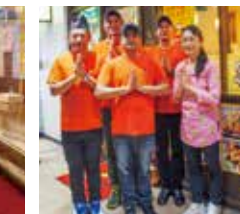
今月号の表紙のお店です

か...。と思いつつ、いつもナンを注文してしまいます!ランチではナンやライスが食べ放題のお得なセットもありますので、お腹も大満足♪辛さも5段階から選べますので、辛いのも好きの方の期待も裏切りません!カレーを食べるならぜひタアバンさんへ足を運んでみてください!今回お得なクーポンもついてきますのでぜひご利用ください!クーポン利用時に注意事項があります、詳しくはスタッフまで