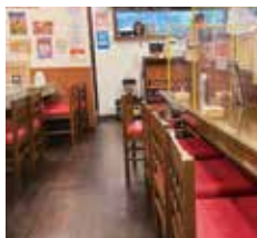
松戸店 テーブル26席ございます。