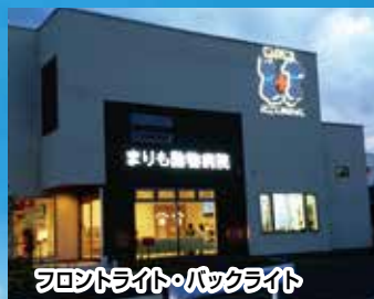
フロントライト・バックライト

大型看板・電飾看板・ ウインドウシート・スタンド看板 バックライトチャンネル文字 袖看板・野立看板・など