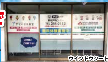
ウインドウシート

大型看板・電飾看板・ ウインドウシート・スタンド看板 バックライトチャンネル文字 袖看板・野立看板・など