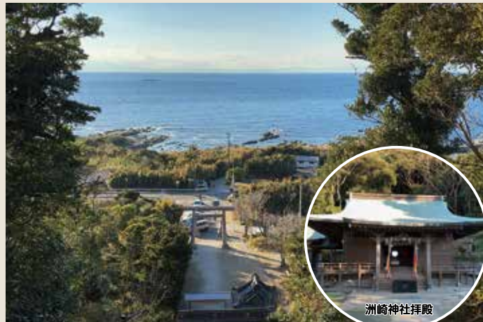
洲崎神社の階段を上がったところから見える景色

千倉駅～館山駅までの道のり 年明けの初ライドは、今まで何回も走っている千倉から館山までのルートです。まずは道の駅潮騒王国でお昼をとり、野島崎灯台へ。今回は灯台の上まで登らず入口付近のみで写真を撮り、道の駅アロハガーデンたてやまへ向かいます。いつもは人が多いイメージがある場所ですが冬のせいかな人が少なかったようです。そして次はいつもは素通りしてしまう洲崎神社へ。今回は洲崎神社の長い階段を上がって拝殿を見にいきました。建物は古いのですが高台にあるので景色は素晴らしいです。おみくじも大吉で良い気分で館山駅に向かえました。