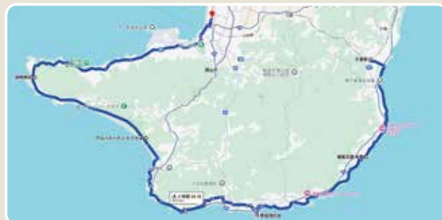
千倉駅～館山駅への道のり：約45.5km(約2時間 50分)