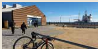
道の駅潮騒王国にて