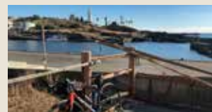
野島崎灯台から少しはなれたところ