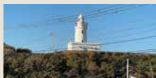
洲崎神社の近くにある洲崎灯台