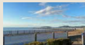
館山駅近くの北条海岸あたりにて