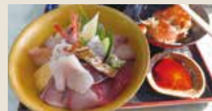
道の駅潮騒王国にて：海鮮丼と蟹汁