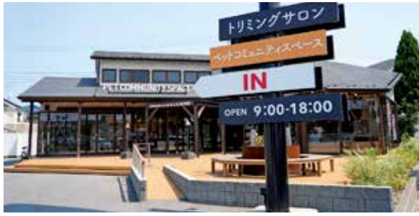
取材協力/保護譲渡施設「ペットと暮らそう」 松戸市古ヶ崎763-1 TEL 070-7782-9927