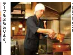
今月の表紙のお店です。