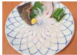
かわはぎのうす造り

4,400円コース +1,650円で2時間飲み放題! 天麩羅・刺身・先附三点盛・ 活サザエつば焼・串盛り合わせ・ 揚物又は茶わん蒸し・食事・フルーツ その他、3,850円・5,500円コースが ございます。 ※価格は税込です。