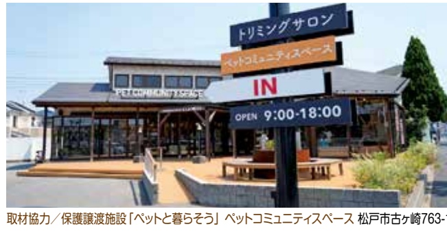
取材協力/保護譲渡施設「ペットと暮らそう」 ペットコミュニティスペース 松戸市古ヶ崎763-1