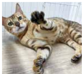
マーボーちゃん 性別 メス / 年齢 推定5才

千葉県松戸市に出来た犬猫の保護譲渡施設「ペットと暮らそう」は、ブリーダーや動物愛護センターから保護をした犬猫たちと里親になりたい方との出会いの場です。今回は里親募集中の猫ちゃんを紹介します。