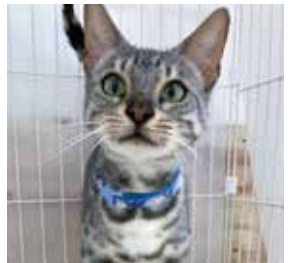
チリちゃん 性別 メス / 年齢 推定3才