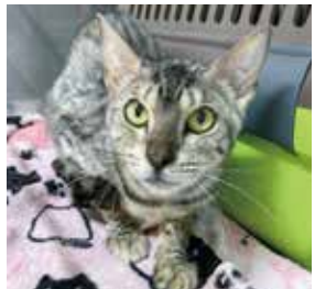
杏仁ちゃん 性別 メス / 年齢 推定2才

保護当初はみんな警戒心高めでしたが、だいたい人馴れして甘えん坊な姿を見せてくれるようになりました。可愛いベンガル4頭が気になる方はお気軽にお問い合わせください。 (TEL)07077829927