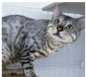
はるまきちゃん 性別 オス / 年齢 推定2才