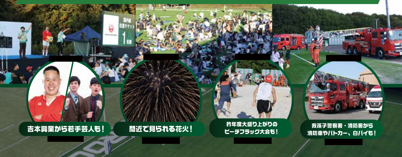
吉本興業から若手芸人も!

昨年は2500名が来場!ラグビーあり、笑いあり、大抽選会もある東葛のビッグイベント!