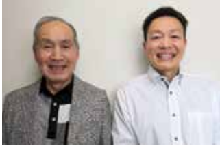
親切・丁寧な対応を心がけています。

金の価格が高騰し、街中ではたくさんの方の買取店を見かけるようになりました。 しかし、買取価格・査定力は店舗によりバラつきが大きく、他店で断られた物や、値段の安かった物も、「実は本物の金だった」ということも多く見受けられます。 当店は70年前から貴金属や宝石を取り扱っており、最新の機器を用いて1点1点査定し、買取価格も都内基準で設定しております。 見積もりだけでも大歓迎です。まずはお気軽にお問合せください。