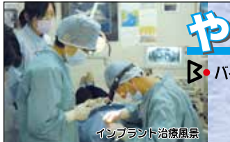
インプラント治療風景