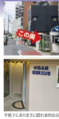
半地下にありまさに隠れ家のお店

駅徒歩2分の好立地なのですが、線路沿いにあるため、中々見つけにくいかもしれません。場所は松戸駅西口を出て線路沿いをキテミテマツド方面へ向かう途中にあります。