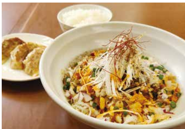
汁なし担々麺と餃子とライス

立地が悪いにも関わらず人気店なのも納得の豚粉屋さん。旨い担々麺と点心が食べたい方はぜひ！！