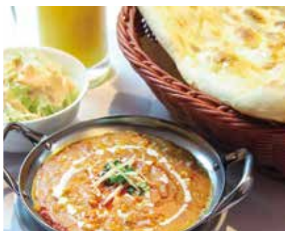
サービスランチ698円 (898円～ナン・ライスおかわりOKのお得なセットもあります！)