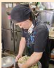
餃子・点心は全て手造り。餃子の餡を心を込めてこねてます。