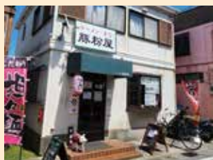
ユニークな店名の豚粉屋

味玉無料クーポン このクーポンを持参の方お一人様 1回に限り1枚まで(2024年8月末まで)