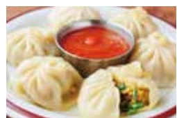
おすすめのサイドメニュー ネパールの蒸し餃子モモ510円

カレーを食べるならぜひタアバンさんへ足を運んでみてください！今回お得なクーポンもついていますのでぜひご利用ください！(クーポン利用時に注意事項があります、詳しくはスタッフまで)