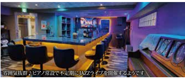
雰囲気抜群♪ピアノ常設で不定期にJAZZライブを開催するようです