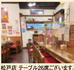
松戸店 テーブル26席ございます。