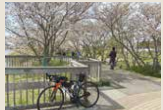
河童像前デッキ付近にて