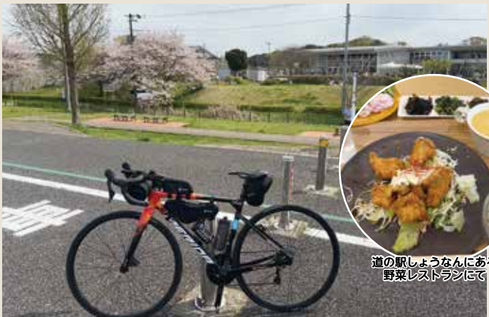
道の駅しょうなんにある野菜レストランにて