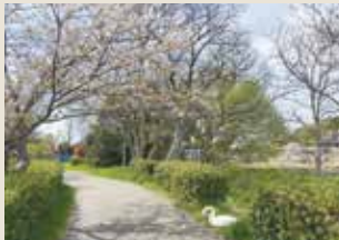
こんなところに白鳥がいました。

筆者プロフィール:50代、身長168cm、体重78kg。夏でも病気以外で食欲が減退したことはありません。糖尿病と交戦中。