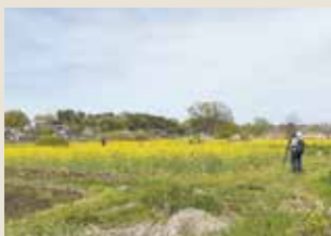
まわりには菜の花がところどころに!