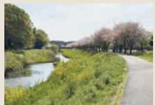
手賀沼から江戸川に向かう途中にて