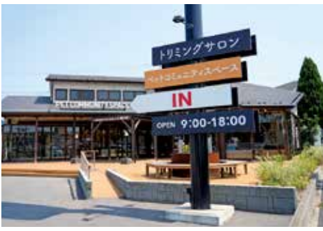
ペットコミュニティスペース外観

クラウドファンディング終了の12月8日まであと数日、どうか皆様の温かいご支援をお願いいたします！