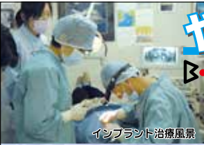
インプラント治療風景