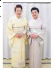
今月号の表紙を飾っていただきました。

人生をより豊かにしてくれる正統派手結び着付け。 少人数制でしっかりと学べ、楽しみながら身につく伝統文化