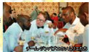
チーム・ゾンパブエのソムリエたち

スクリーン2・3で上映される映画は、他にも多数ございますので詳しくは公式サイトをご覧ください。