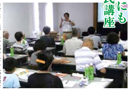
※セミナーはソーシャルメディアの確保を 行った上で開催いたします。

残念なことに塗装業 には、なんの免許も資格 も必要がないのです。国 家資格である一級塗装 技能士資格を取得しな くても、施工する事が出 来るのです。 故に知識のない職人 たちは、其々の自己基準