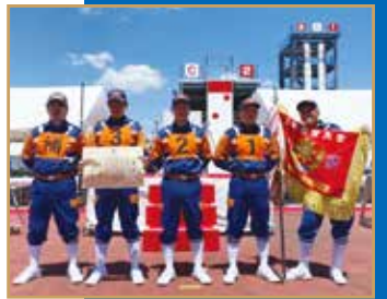
千葉県消防操法大会 優勝 選手写真