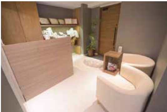
完全個室プライベートサロンです。

松戸駅西口目の前!完全個室のプライベートサロン! アロマの香りが心地良い癒しの空間で日頃の疲れをリフレッシュ!