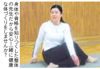
身体や骨格を知りつくした整体の先生だから安心!一緒に健康な体づくりをしませんか?