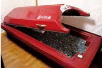
他では真似できない「本物の岩盤浴」、ぜひお試しください。

世界の論文で証明された北投石を使用した岩盤浴。免疫力もアップし、健康的な身体を維持!