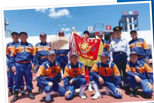
千葉県消防操法大会 優勝

まずはトップに立ち選手たちの顔にも笑顔があふれましたが、まだ残り3消防団が残っています。その中には全国大会出場経験のある消防団もあり油断ができません。8番目の得点が発表され依然としてトップをキープ。そして9番目出場の市川市消防