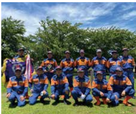
東葛飾支部消防操法大会 優勝

もつてさらなる練習を積み重ねました。そして7月30日、市原市の千葉県消防学校にて開催された第58回千葉県消防操法大会の日を迎えました。