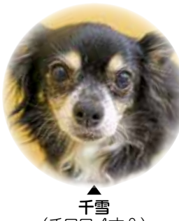
千雪 (チワワ 4才♀)