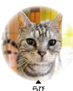
らび (アメシヨ 11才♀)