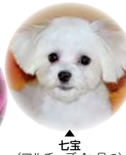
七宝 (マルチース 4ヶ月♂)