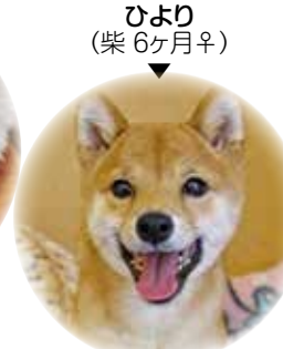
ひより (柴 6ヶ月♀)