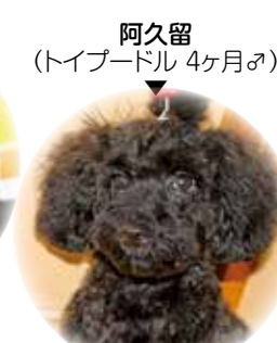
阿久留 (トイプードル 4ヶ月♂)