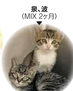
泉、波 (MIX 2ヶ月)