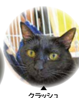
クラッシュ (MIX 1才♂)