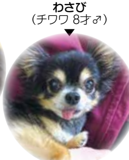
わさび (チワワ 8才♂)