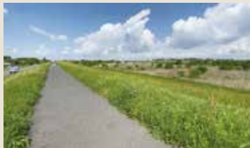
利根川サイクリングロードにて