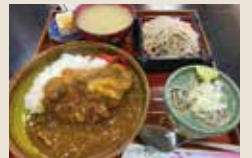
野田のそば屋にて

今回は印西牧の原〜松戸までの道のりです。利根川沿いを走っているとタヌキ?みたいなのがいてびっくりしました。写真にとっておけばよかったですね。草が繁っているとバツが多いので昆虫が苦手な私には困りものです。