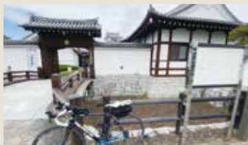
関宿城博物館前にて