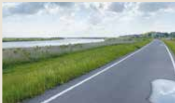
利根川サイクリングロードにて