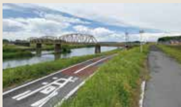
江戸川サイクリングロードにて

関宿城博物館の売店でマックスコーヒーアイスを発見! 缶コーヒーよりは甘くなく美味しいです。ちょっと値段が高めですが食べてみる価値はあると思います。